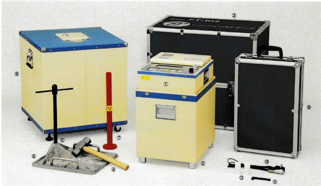
①計器本体 ②標準体 ③収納トランク ④鉄ハンマー ⑤打ち込み棒 ⑥ベースプレート ⑦線源筒 ⑧付属品収納箱 ⑨線源棒収納器 ⑩充電ケーブル ⑪インクリボン ⑫ロール紙