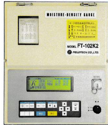
RI水分・密度計 【FT-102K2】 【FT-102Z2】 【FT-102S2】