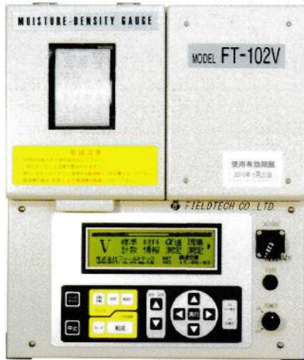
新型RI水分・密度計 【FT-102V】

2013年9月よりFT-102シリーズにVタイプが加わりました。これまで数多くのユーザー様に長年ご愛用頂いてきたK、Z、Sタイプとサイズはほとんど変わりませんが、約1.5kg軽量化したため持ち運びが楽になりました。またバッテリーの持ち時間も、従来型と比べて約1.6倍長くなりました(当社比)。新機能として試験施工モードが追加され、測定データは汎用のUSBメモリに出力出来るようになりました。USB出力により、測定結果から容易に帳票を作成することができます。